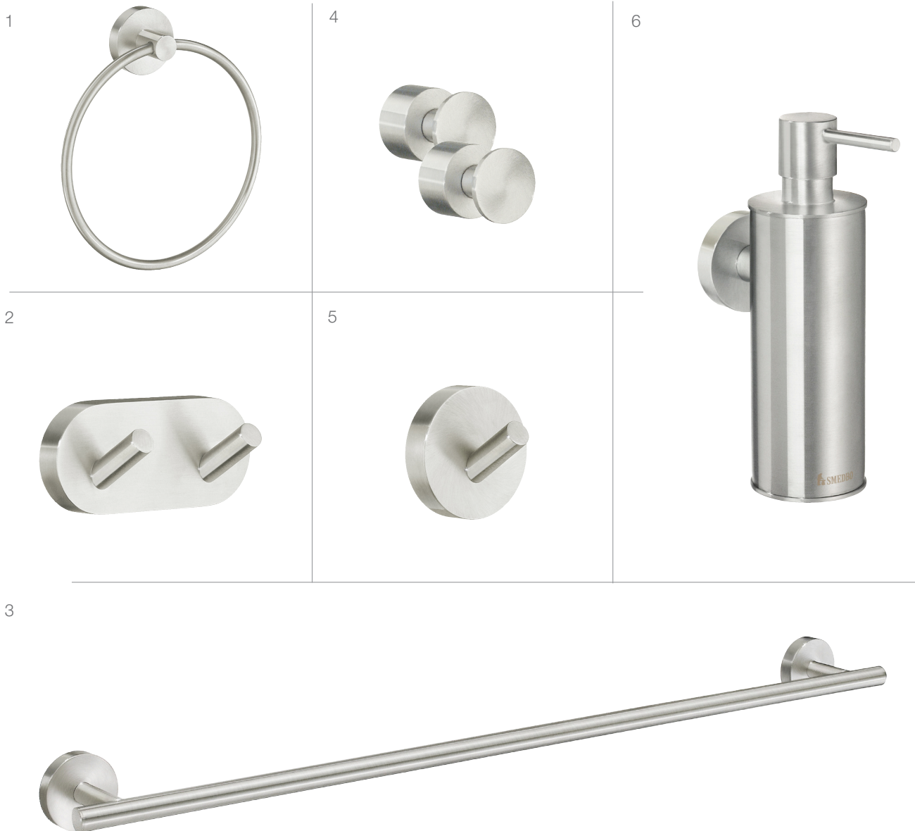
1 H344N Towel ring Handduksring Håndklædering Håndklering Pyyherengas Handtuchring Ø 170 mm